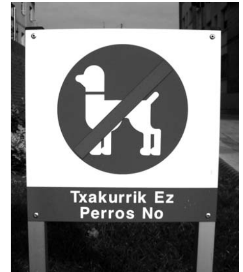
La señalización es insuficiente y poco clara

La policía municipal tiene órdenes de multar a quien incumpla esta normativa. ¿Serán igual de severos con los delincuentes callejeros?